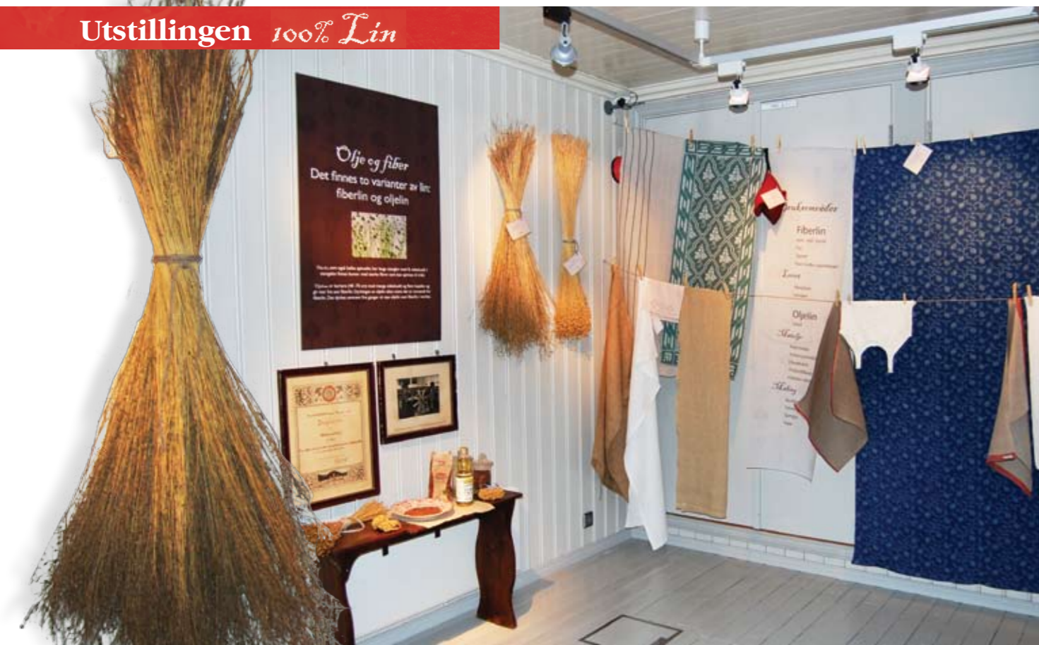
Utstillingen «100% lin» var den første i den nyrestaurerte østfløyen av Tøyen hovedgård.