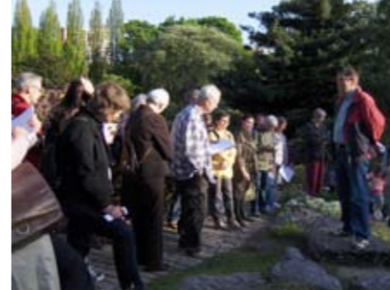
Til sammen tre utekvelder avsluttet vårens guidekurs