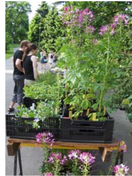
Hva er dette?