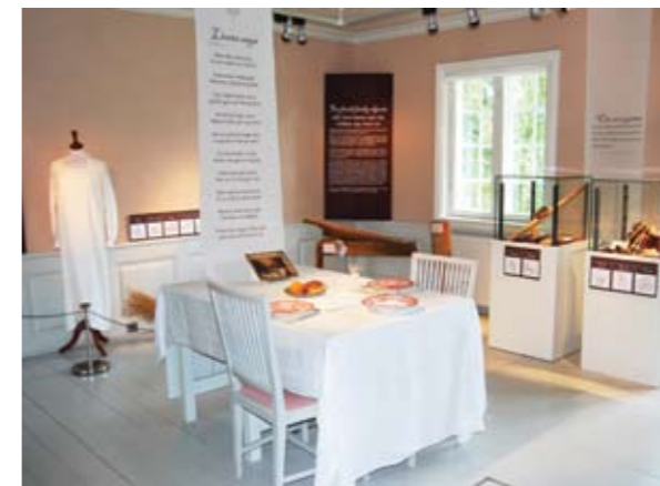
Utstillingen var både pedagogisk og vakker, og viste noen av linens mange bruksområder.