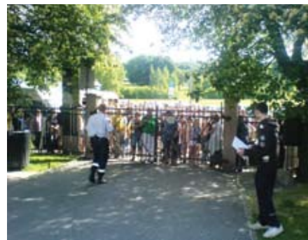
Flere hundre sto i kø utenfor portene da Botanisk hage åpnet for Vårtreffet kl 10