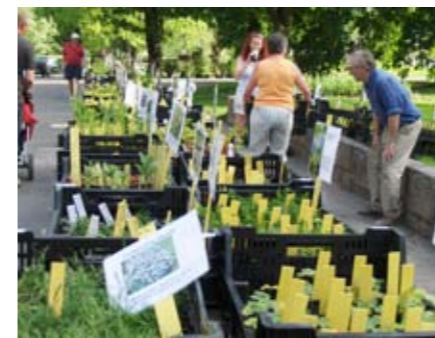
Kassene med stauder er klargjort for salg.