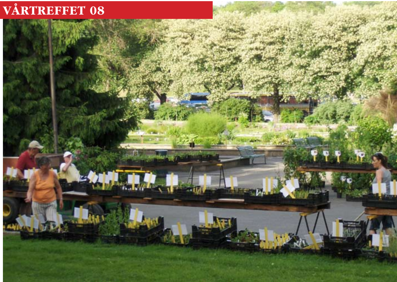
Mye tid går med til å sette fram alle plantene før publikum slippes inn i hagen.