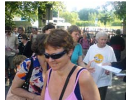
Det var kamp om å komme først frem til salgsbordene da portene åpnet.

På vei mot etterlengtet skygge? Også i år var det mange grønne foreninger som tiltrakk seg interesse ved driftsbygningene og Botanisk museum.