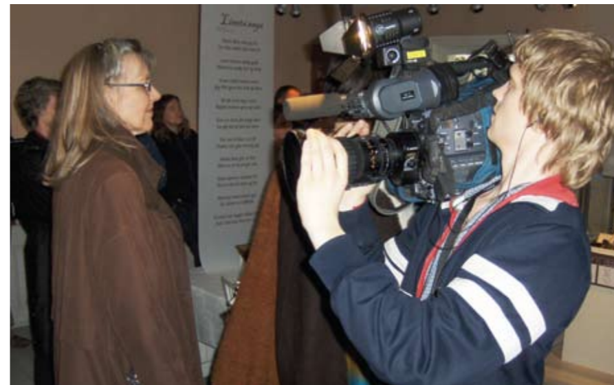
Det var stor interesse fra mediene da linutstillingen ble åpnet i april.

syrer. Linfrøene inneholder 30-40% olje. De er rike på protein og Omega 3 og 6. Linolje har et høyt innhold av de umettete fettsyrene linol- og linolensyre. Den brukes i kremer, salver og såpe. Oljen brukes som bindemiddel i maling på bygninger og skip, i interiør og på møbler. Blandet med terpentin, fyllstoffer og pigmenter blir blandingen lett å stryke ut. Når løsemiddelet er fordampnet, størkner linoljen og binder fargen. Linolje tørker raskt og er bestandig mot vær og vind.