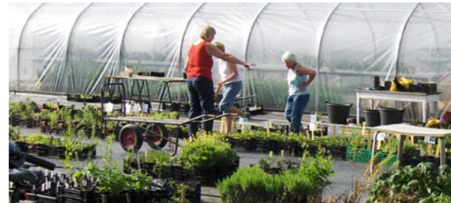
Under Vårtreffet skjer det mye arbeid bak kulissene, med henting og bæring og utkjøring

Planlegging av arbeidet i kaféen starter i januar, siden vi må reservere utstyr for å få traktet store mengder kaffe. Den store arbeidsinnsatsen skjer i ukene før Vårtreffet, med detaljplanlegging og innkjøp. Vi holder øye med langtidsvarslet, for været har stor be-