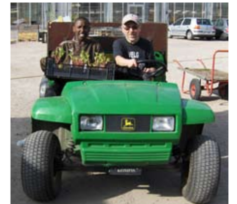
Det blir utallige turer fra Forsøksfeltet.

På selve vårtreffdagen kjøres kasser frem kontinuerlig. Dette skjer på anmodning fra selgerne som gir beskjed om hvilke planter som må hentes frem. Tomme kasser skal også kjøres tilbake. God kommunikasjon og oppfølging er nødvendig. Når alt er over har vi et berg av tomkasser på forsøksfeltet – da spør vi oss selv: «Var det virkelig såååå mange?»